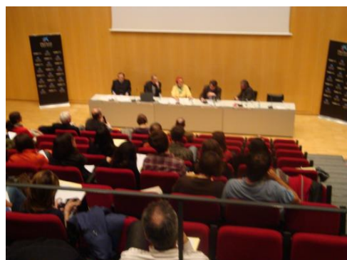
I Seminari d'ètica i periodisme